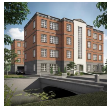
Laan van Zuid Hoorn 15 2289 DC Rijswijk