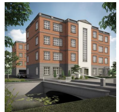
Laan van Zuid Hoorn 15 2289 DC Rijswijk